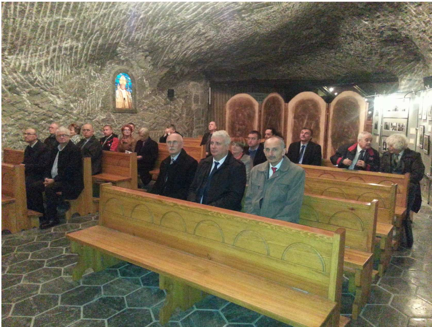
Msza św. w intencji samorządów powiatowych Województwa Małopolskiego w kaplicy św. Jana.