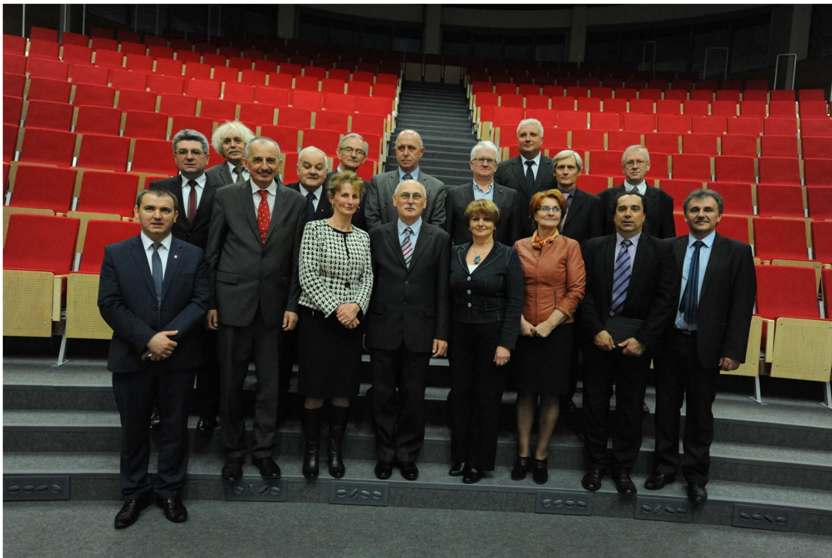
Uczestnicy Konwentu na tradycyjnej wspólnej fotografii.