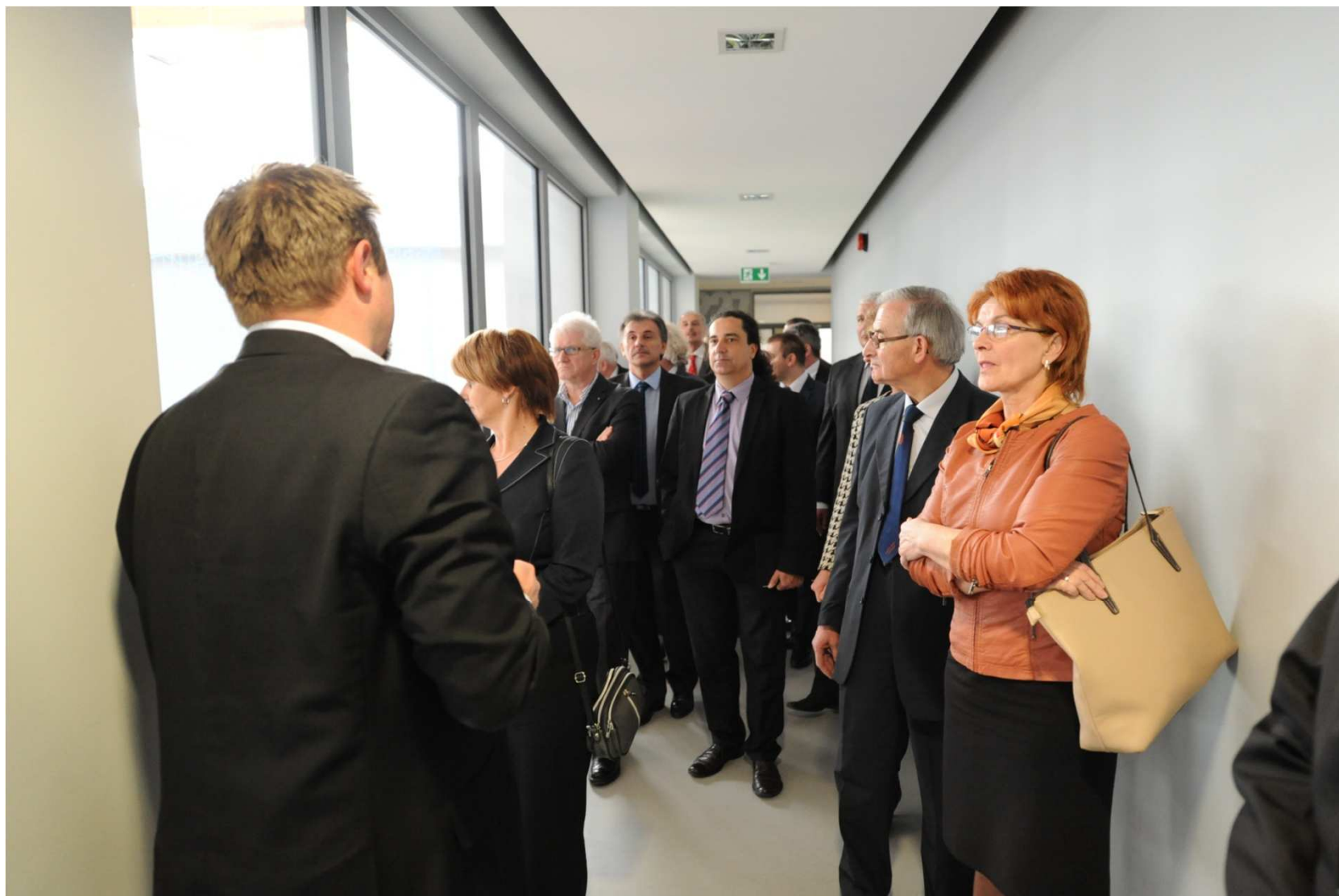
Zwiedzanie Powiatowego Kampusu Wielickiego.