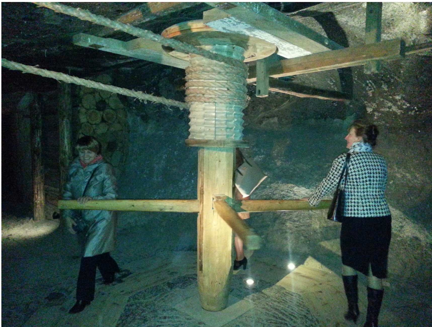
Zwiedzanie kopalni z licznymi atrakcjami.